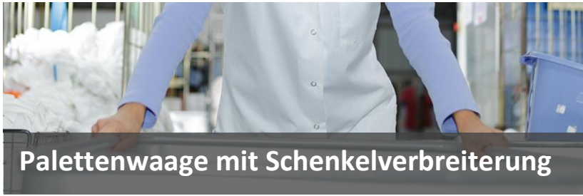
Palettenwaage mit Schenkelverbreiterung